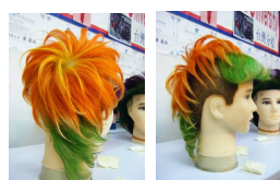
備註：A4 男子奇幻藝術造型組